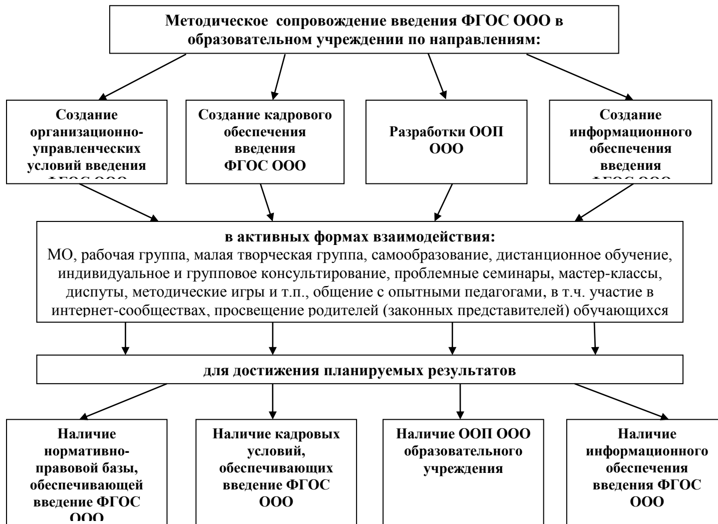
Рис. 5. Схема методического сопровождения введения ФГОС ООО в образовательном учреждении

В основе модели методического сопровождения введения ФГОС ООО лежат следующие принципы :